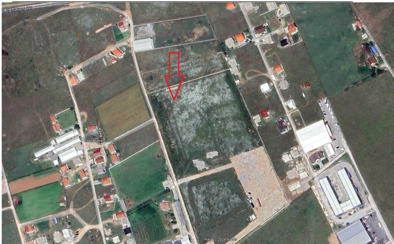
Slika 2. Lokacija objekta (označen strelicom) sa užom okolinom.