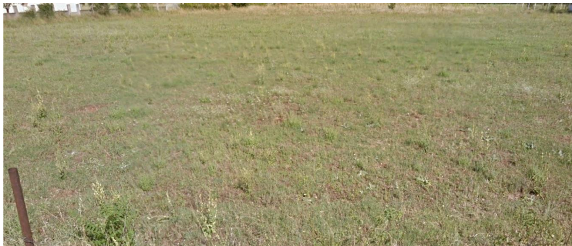
Slika 3. Postojeći izgled lokacije (pogled sa jugozapadne strane)