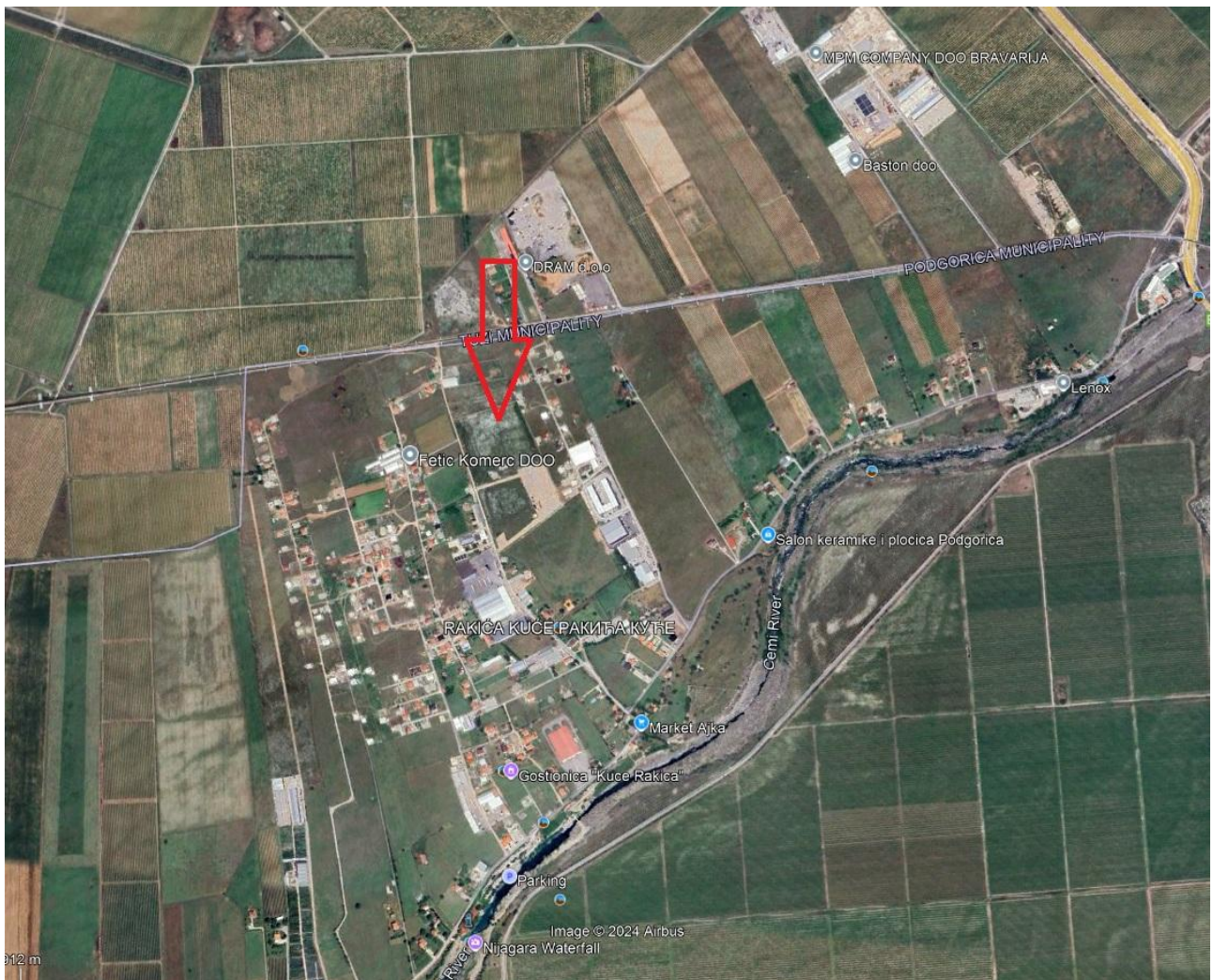
Stika 1. Geografski položaj lokacije objekta (označen strelicom)

Prilaz lokaciji objekta je omogućen sa lokalnog asfaltnog puta a koji se odvaja od magistralnog puta Podgorica-Tuzi.