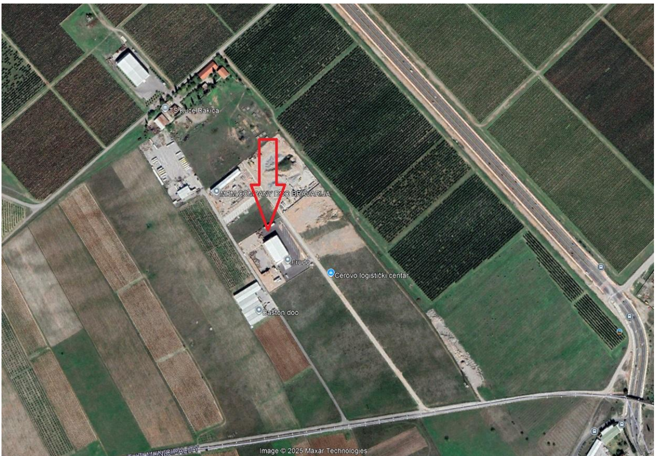
Slika 1. Geografski položaj lokacije objekta (označen strelicom)

Prilaz lokaciji objekta je omogućen sa lokalnog asfaltnog puta a koji se odvaja od magistralnog puta Podgorica-Tuzi.