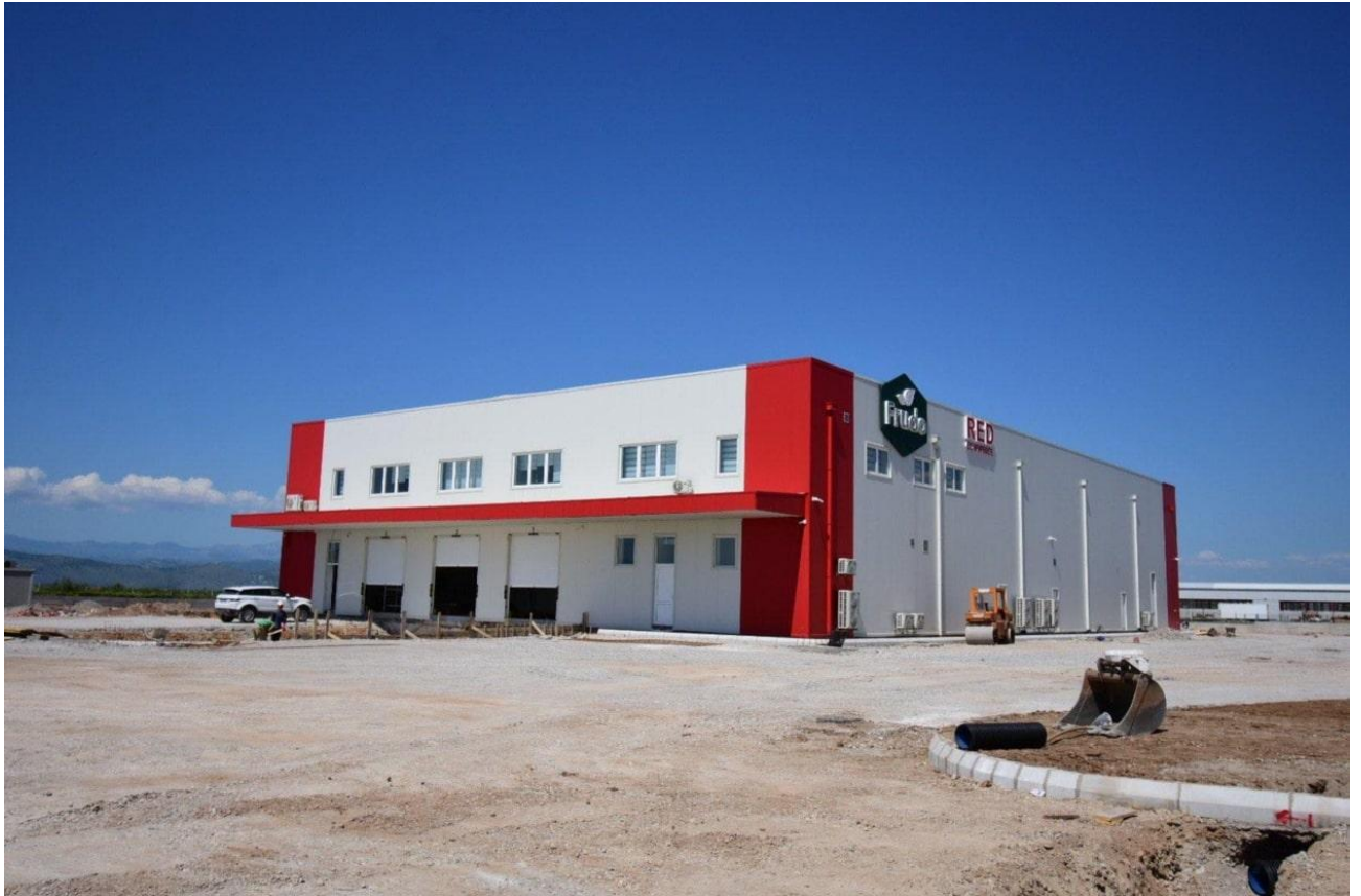
Slika 3. Postojeći izgled lokacije (pogled sa sjeveroistočne strane)

Dominantni morfološki oblici u užoj okolini lokacije je pojas zaravljelog tla sa koritom rijeke Cijevne, a u široj okolini padine okolnih brda, koje su izgrađene od karbonatnih stijena, a blaže nagnute padine od flisnih sedimenata.