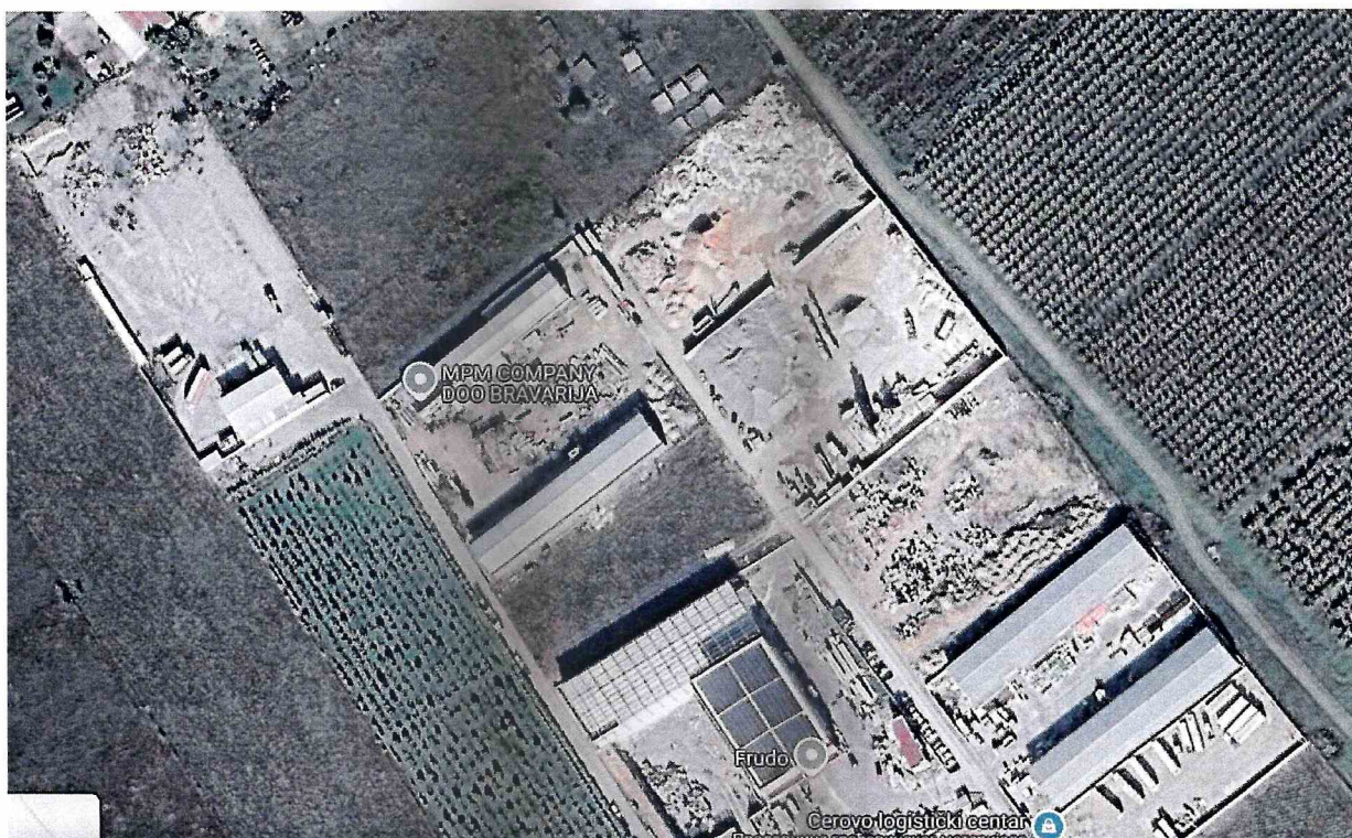
Slika 2. Lokacija objekta sa užom okolinom

Dominantni morfološki oblici u užoj okolini nema, a u široj okolini padine okolnih brda, koje su izgrađene od karbonatnih stijena, a blaže nagnute padine od flisnih sedimenata.