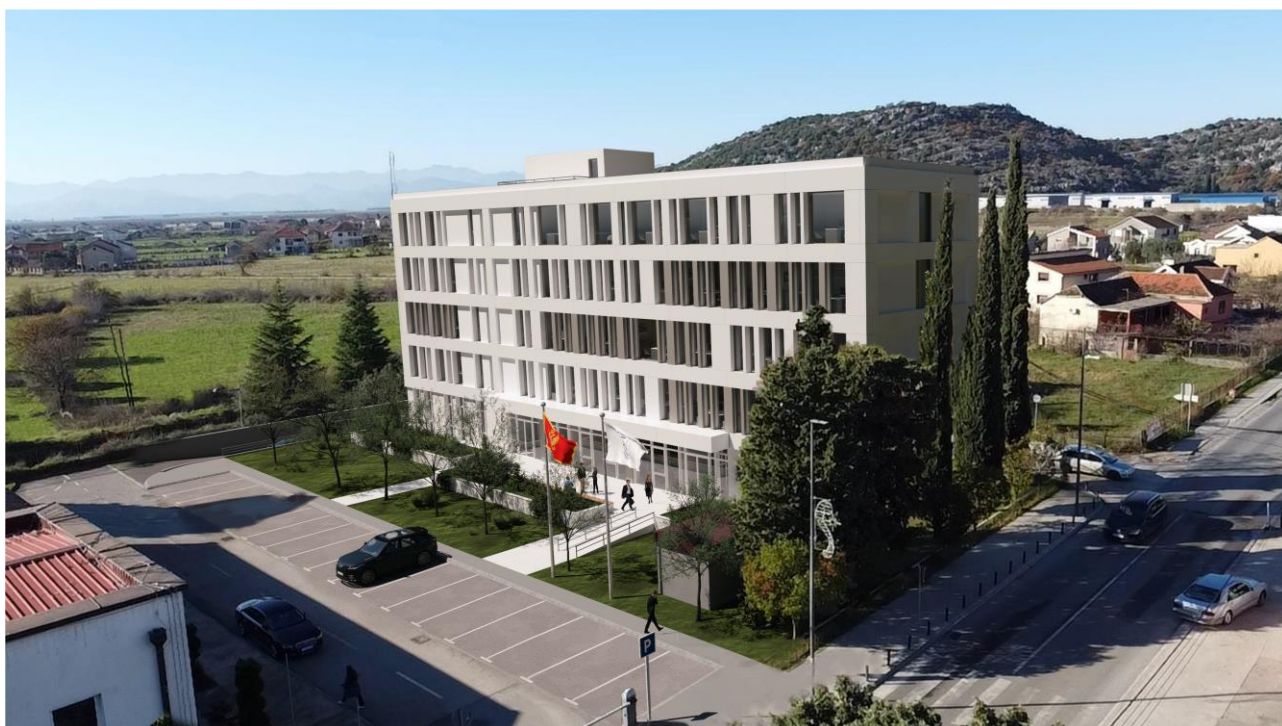
Slika 4. 3D prikaz izgleda objekata - Upravne zgrada Opštine Tuzi

Površina objekta po etažama i ukupna površina objekta prikazane su u tabeli 2.