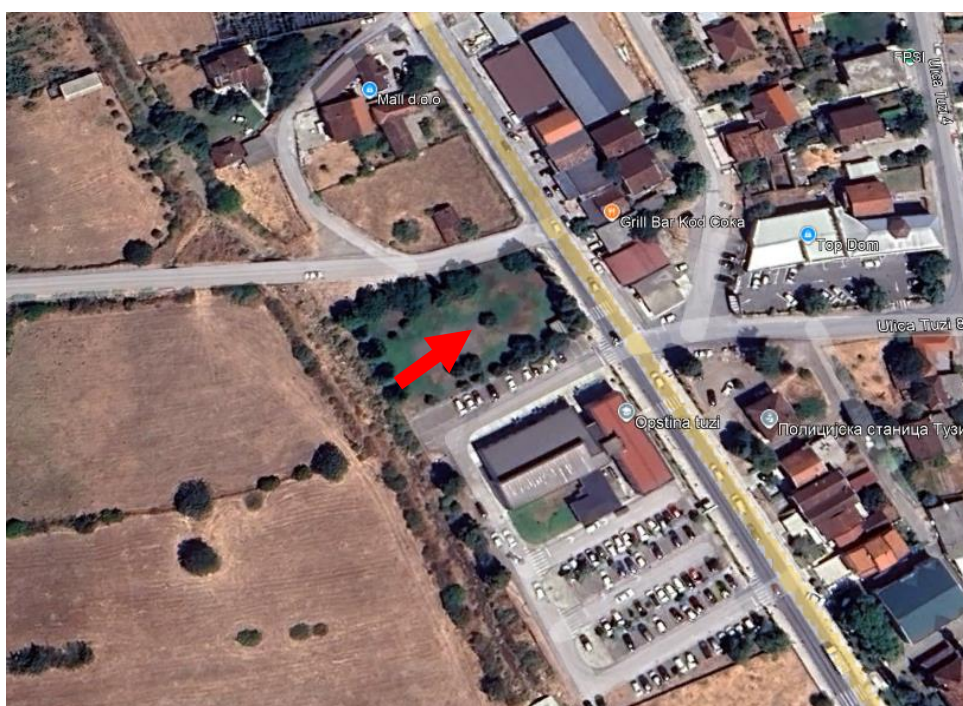
Slika 2. Lokacija objekta (označena strelicom) sa užom okolinom

Postojeći izgled lokacije prikazan je na slici 3.