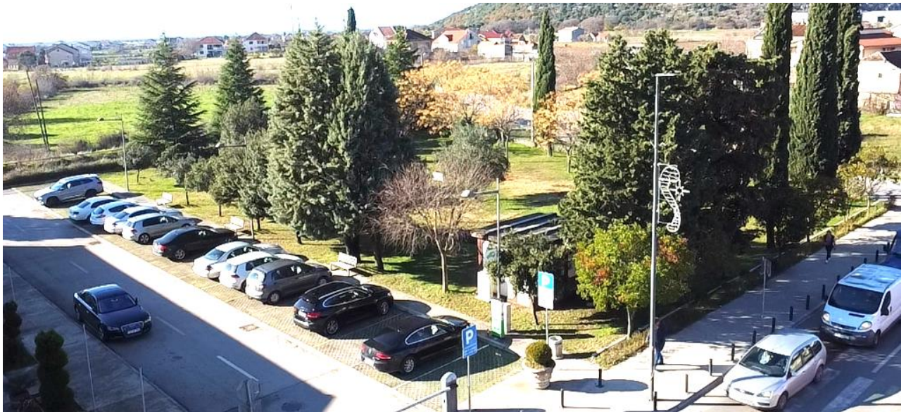
Slika 3. Postojeći izgled lokacije

Lokacija predstavlja ravnu travnatu površinu na kojoj nema objekata. Na lokaciji po obodu nalazi se određeni broj stabala visokog rastinja.