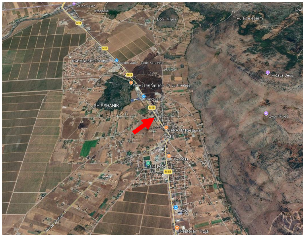
Slika 1. Geografski položaj lokacije objekta (označen strelicom)

Položaj lokacije objekta - Upravne zgrade Opštine Tuzi u Tuzima data je na slici 1, a na slici 2 prikazana je lokacija objekta sa užom okolinom.